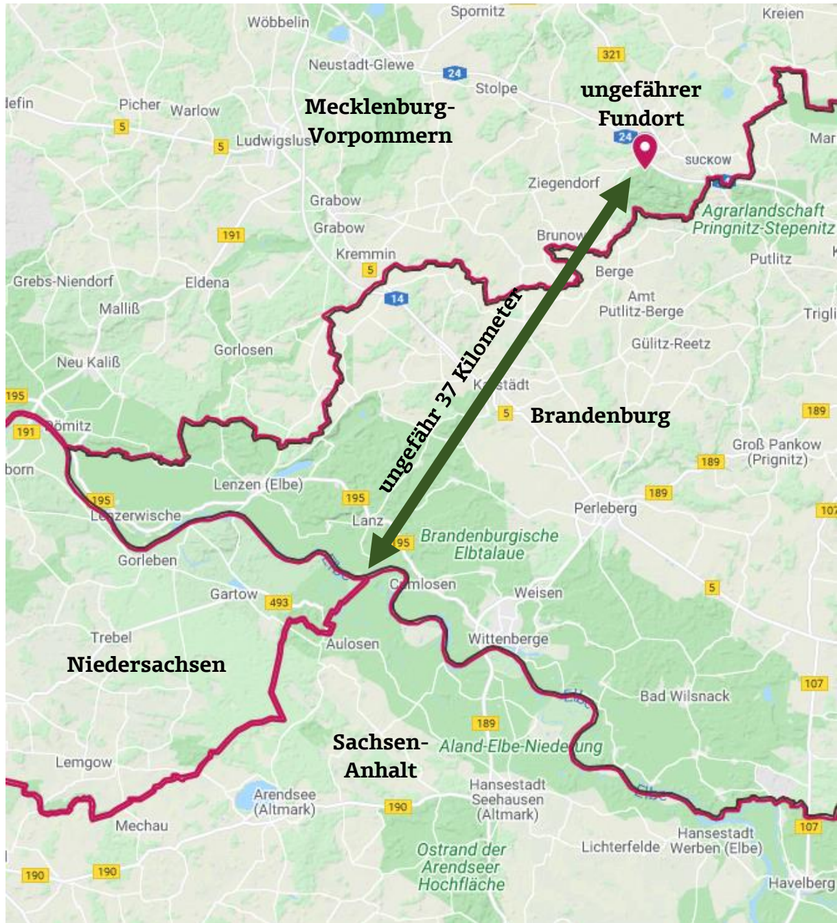
Abbildung 1: Darstellung des ungefähren Fundorts mit Bezug auf die Bundesländer